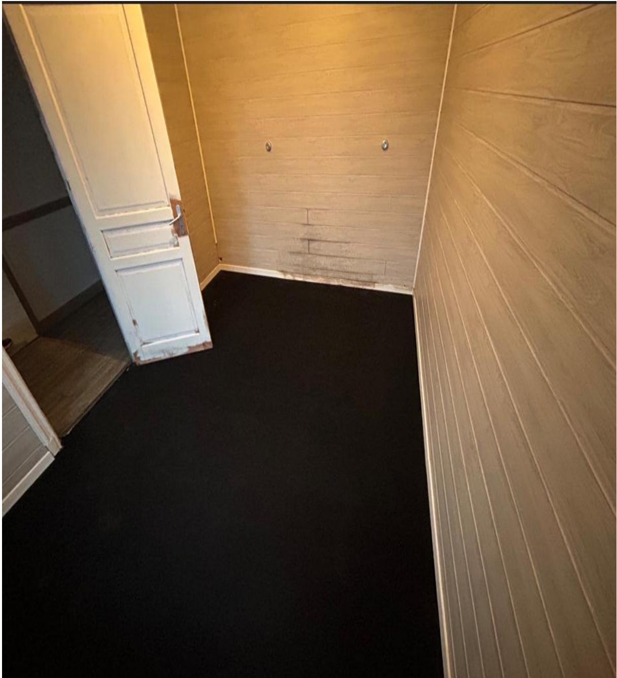
PHOTO D'ENSEMBLE AVANT TRAVAUX

Pose de parquet flottant surface environ 12 m 2 Pose des plinthes 14 mètres